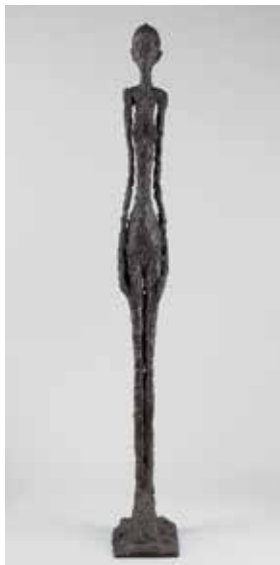
© Alberto Giacometti, Grande femme I, 1960. Bronze ; 272 x 34,9 x 54 cm. Fondation Giacometti, Paris. © Succession Giacometti (Fondation Giacometti + Adagp, Paris)

Samedi 16 mars de 10h30 à 11h30 et vendredi 26 avril de 11h à 12h